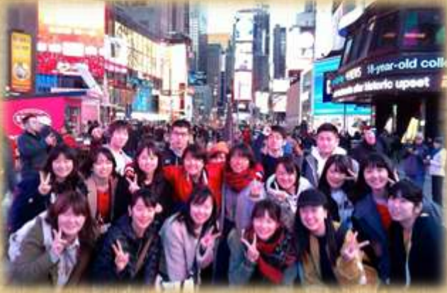
ニューヨークのタイムズスクエアにて